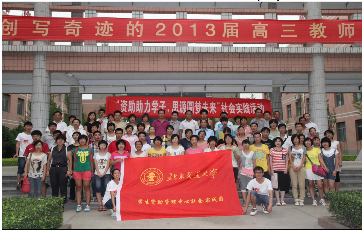
学生资助管理中心“资助助力学子，思源圆梦未来”实践团赴河北开展社会实践活动